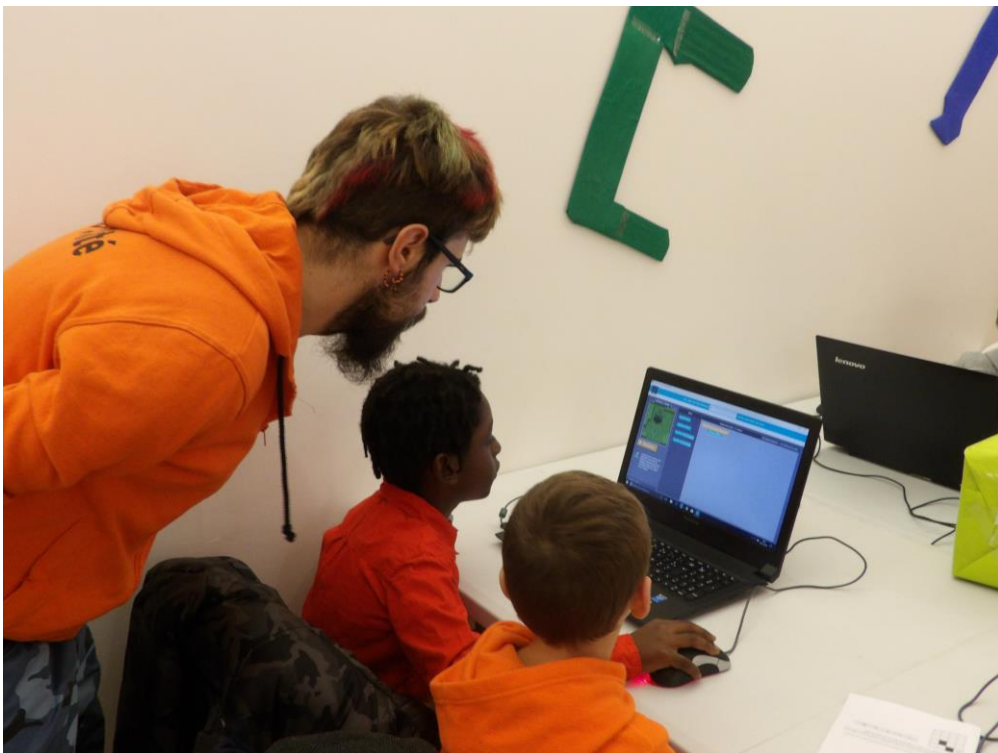
Ateliers réalisés avant la période de confinement

Un formulaire d'inscription préalable est mis en ligne pour les familles intéressées.