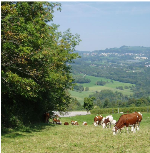
Troupeau abrité par une haie.

Au Gaec du Bois joli, producteur renommé de saint-nectaire, la question du bien-être animal est préoccupation majeure. Faire pâturer les vaches et génisses dans des prairies ombragées et abritées du vent par des haies est une évidence sur ce territoire de montagne à près de 1000 m d'altitude et sur lequel les canicules sont nouvelles mais de plus en plus fréquentes. Les animaux non abrités subissent un stress, ce qui impacte leur bien-être et leur production. Les plantations complètent le bocage en place pour apporter toute la journée de l'ombre et protéger des vents dominants.