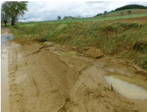
Érosion de sol suite à une forte pluie, secteur de la Limagne des Buttes.

Les coteaux de Limagne sont régulièrement soumis à des problématiques d'érosion de sols lors d'évènements de pluie intense. Les haies, lorsqu'elles sont implantées perpendiculairement au sens de la pente, permettent de ralentir le ruissellement, de faciliter l'infiltration de l'eau grâce aux racines et de piéger les particules érodées. La haie plantée ne jouera pas complètement ce rôle car elle est implantée dans le sens de la pente. Mais elle s'insère dans une réflexion globale de la commune d'Artonne pour planter des haies et