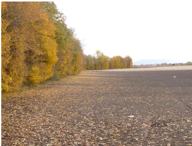
Haie plantée il y a 35 ans en Limagne qui agit comme un brise-vent protecteur des cultures.

En zone céréalière, les arbres et haies sont peu nombreux. Dans un contexte de changement climatique, les haies ont un rôle agroécologique à jouer : limiter l'intensité du vent qui dessèche les cultures, optimiser l'irrigation, favoriser les auxiliaires des cultures, apporter de l'humus stable dans les sols et, à terme, produire du bois.