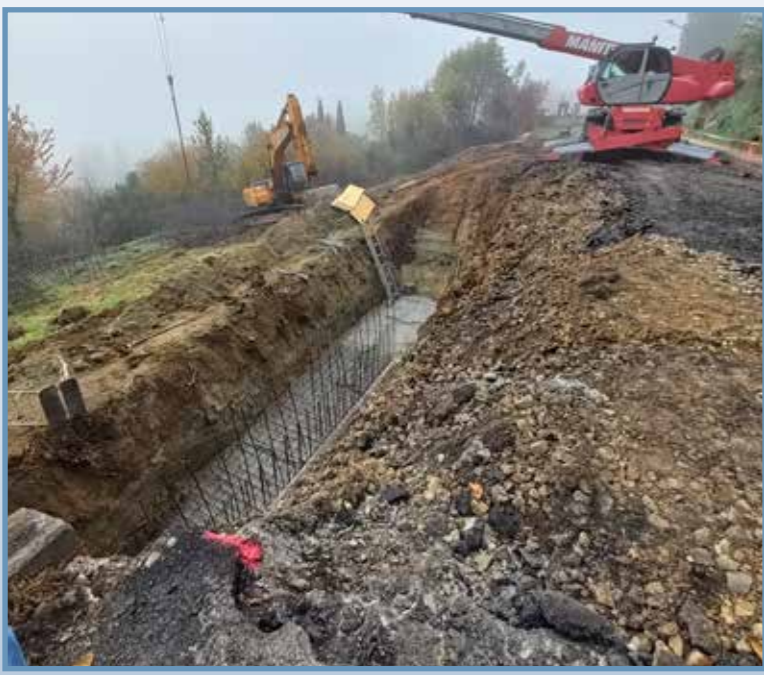
Pendant les travaux

Dans le cadre de son programme d'investissement routier, le Conseil départemental du Puy-de-Dôme a engagé en 2021 des travaux sur la RD 15, située sur le canton de Châtel-Guyon.